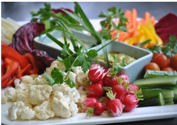
Plateau de crudités