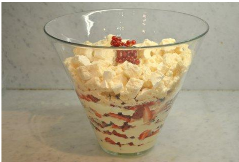
La Pavlova aux fruits rouges

Salade de fruits et coulis de fruits rouges (GF) (V)